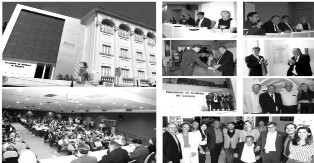
A cerimônia de inauguração foi realizada na sexta-feira (31/03/23) e contou com a presença de diretores, professores, coordenadores, colaboradores, estudantes, autoridades do município, membros de colegiados e da comunidade em geral.