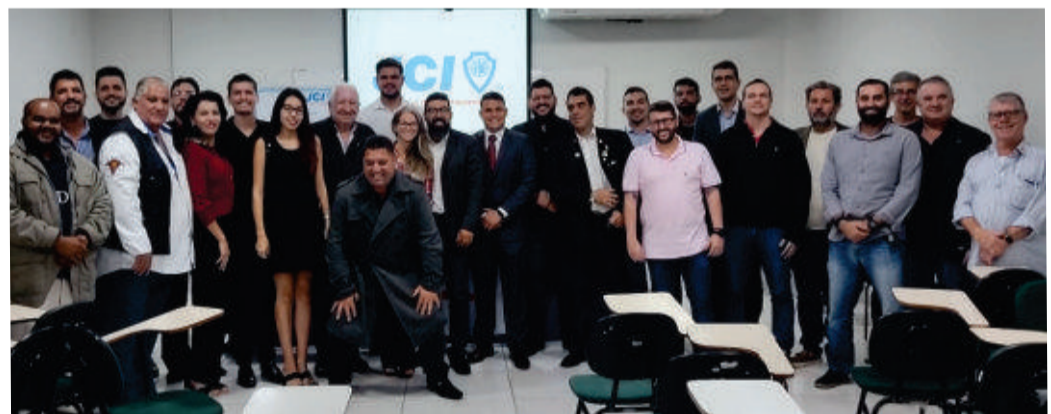
Diversas autoridades prestigiaram a reunião festiva da JCI