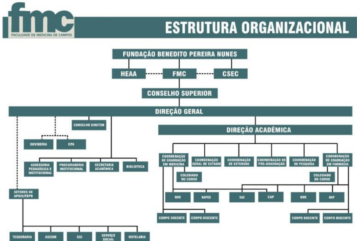
Figura 4. Organograma representativo da organização da entidade mantenedora e seus segmentos. (Fonte: Aditamento do Plano de Desenvolvimento Institucional, 2019).

O Conselho Superior (CONSUP), órgão deliberativo, normativo e consultivo da FMC, terá a seguinte composição: Diretor Geral (Presidente), Vice-Diretor, Representante da Entidade Mantenedora, Coordenadores de Cursos de Graduação, Coordenador Geral de Estágio, Coordenador de Pós-Graduação, Coordenador de Extensão, Coordenador de Pesquisa, um Docente de cada Curso de Graduação e um Representante da Associação dos Docentes da Faculdade de Medicina de Campos (ADOMECA), todos com mandato de dois anos; um discente de cada curso de Graduação; um Representante dos respectivos Diretórios Acadêmicos; um Representante da Secretaria Acadêmica e um Representante da Associação dos Funcionários da FMC (AFAMEC).