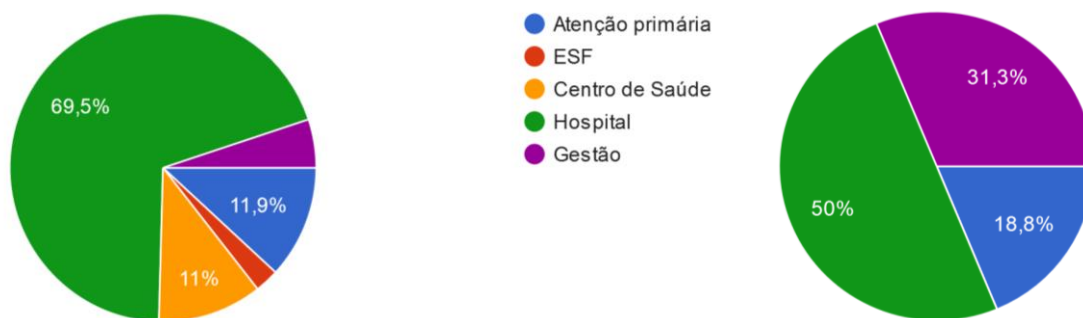
Figura 2. Percentual de egressos atuantes em diferentes níveis hierárquicos no SUS. Grande parte dos egressos do Curso de Graduação em Medicina (Gráfico da esquerda, n=133) e em Farmácia (Gráfico da direita, n=37) que atuam no SUS, trabalham em Hospital.

Os egressos de ambos os Cursos de Graduação da FMC atuam em diferentes níveis hierárquicos do Sistema Único de Saúde como pode ser observado na Figura 2 .