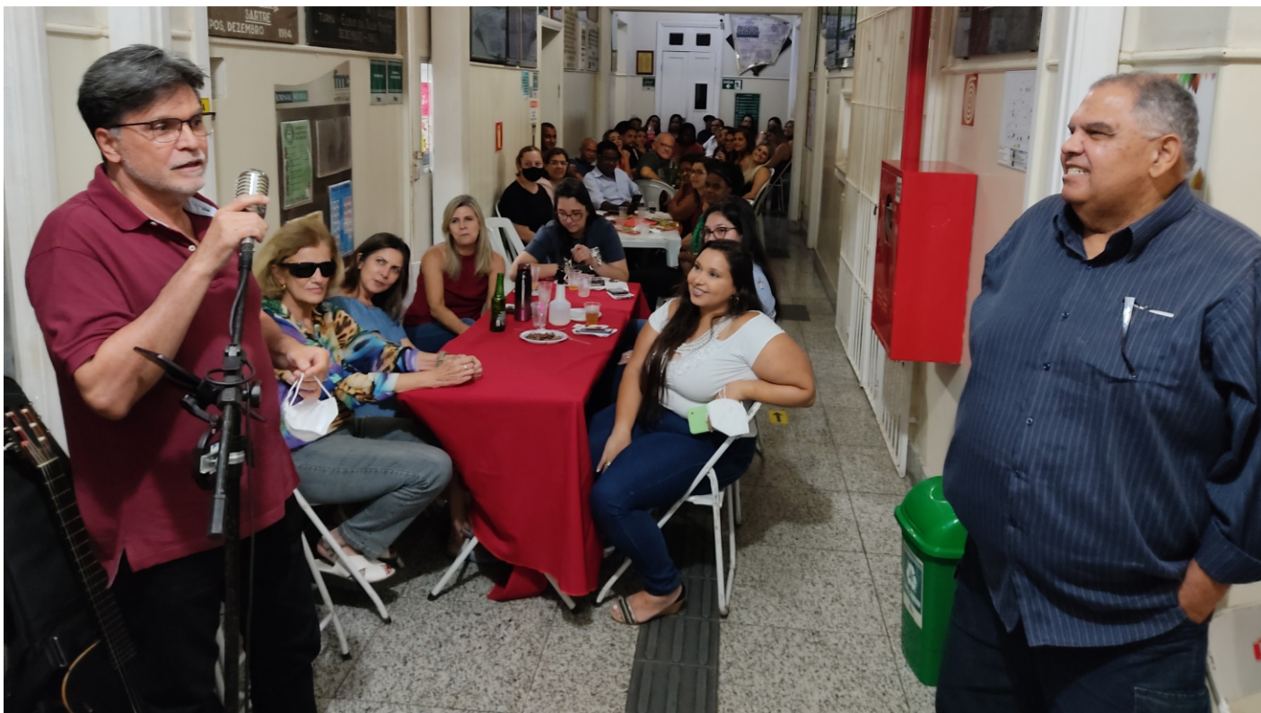
Os colaboradores da Faculdade de Medicina de Campos e Centro de Saúde Escola de Custodópolis ganharam uma festa de confraternização natalina com direito a música ao vivo e sorteio de brindes.