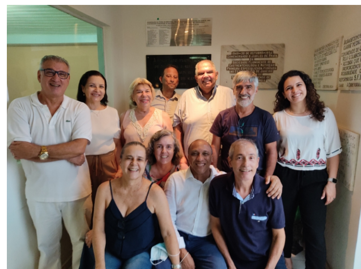
A turma do Curso de Graduação em Medicina de 1981, ao completar 40 anos de da formatura, prestou homenagem à Sociedade Fluminense de Medicina e Cirurgia - SFMC, pelo seu centenário. A cerimônia de descerramento da placa comemorativa aconteceu no dia 11 de dezembro no Salão Social da SFMC.