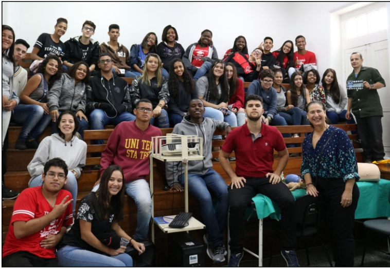
Alunos do Colégio Estadual Dr. Silvio Bastos Tavares visitaram a Faculdade de Medicina de Campos no dia 29 de agosto. Conheceram o Museu Histórico, o Laboratório de Anatomia e tiveram uma aula de primeiros socorros.