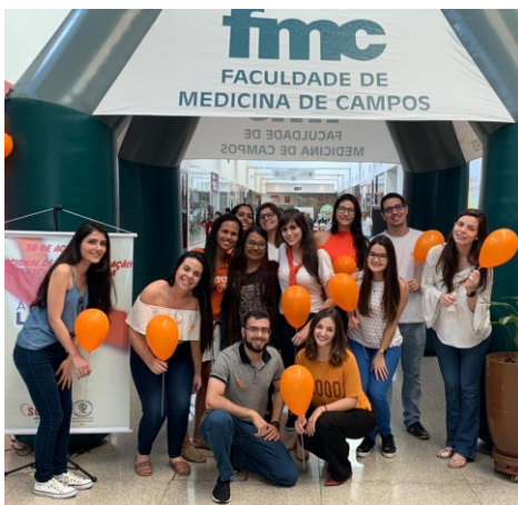
A Liga Acadêmica de Neurologia da Faculdade de Medicina de Campos promoveu uma ação social no dia 30 de agosto, no Boulevard Shopping de Campos, para marcar o Dia Nacional de Conscientização da Esclerose Múltipla. Foram distribuídos materiais informativos, como também os estudantes prestaram esclarecimentos pertinentes à doença.