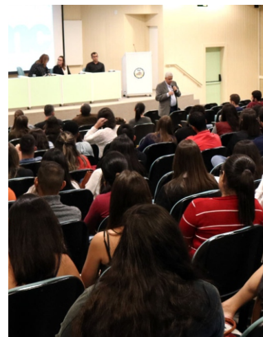
FMC PROMOVE MESA-REDONDA "DE CARA LIMPA"

A Faculdade de Medicina de Campos promoveu no dia 29 de agosto, uma Mesa-redonda intitulada "De cara limpa", com a participação de profissionais de diversas especialidades.