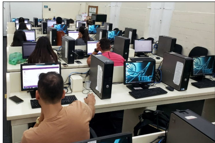
No dia 25 de novembro acontecem as provas do Exame Nacional de Desempenho dos Estudantes (Enade) que avaliará o rendimento dos concluintes dos Cursos de Graduação em relação aos conteúdos programáticos previstos nas diretrizes curriculares dos cursos. A FMC se antecipou e contratou duas plataformas digitais que promoveram simulados das provas, tanto para os estudantes de medicina quanto para os de farmácia.